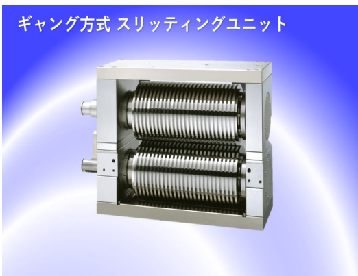
ギャング方式 スリッティングユニット