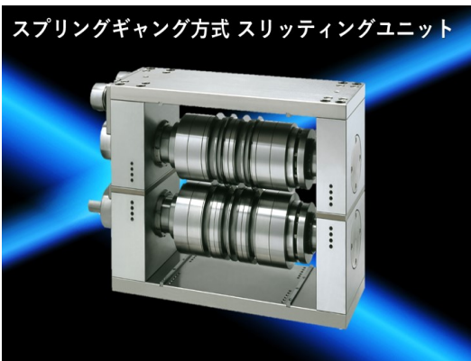
スプリングギャング方式 スリッティングユニット

ギャング方式の切口対称性、ゲーベル方式の扱いやすさ等双方の長所を取り入れたユニットです。