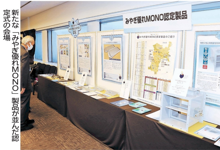
新たな「みやぎ優れMONO」製品が並んだ認定式の会場