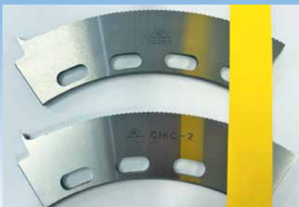
面粗比較 上:従来品 下:CIKC-2